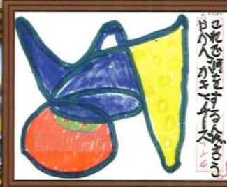
那覇市のしろさん