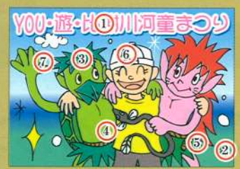
イラスト:キジムナ 前津智宏