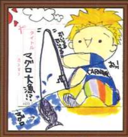
那覇市の種さを秘めたハートビートさん