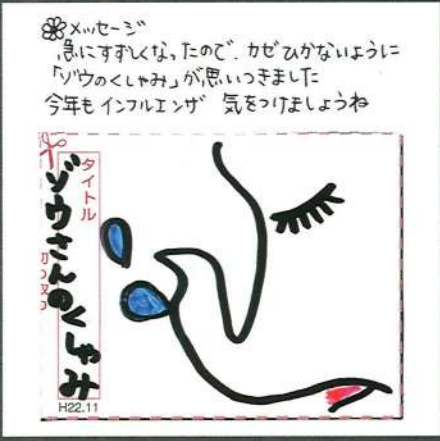
豊見城市のクロタロウさん